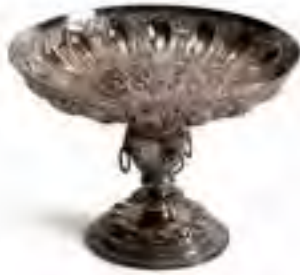
Zilveren tazza, objectnr. 0355

ZIERIKZEE - Wat gebeurt er in het Zeeuwse stadje Zierikzee tijdens het Rampjaar? Hoe redeloos is het volk hier en hoe radeloos is de stedelijke regering? Zeeland is het eerste gewest dat prins Willem III benoemt tot stadhouder. Ook in Zierikzee lopen de gemoederen hoog op.