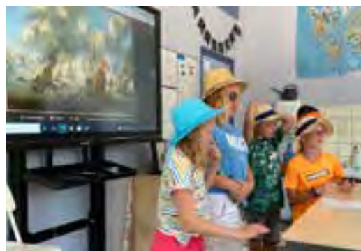
Voorjaar 2021 werd een pilot Rampjaar voor kids uitgevoerd op tien basisscholen in Midden-Holland

Het project omvat de volgende producten: 1. lespakket met een digitale presentatie van het Rampjaar voor klassikale vertoning met korte filmpjes, posters en kaarten over het Rampjaar 1672 en een docentenhandleiding met tips en lessen voor verwerking. Het pakket bevat ook links naar reeds bestaande educatiepakketten over