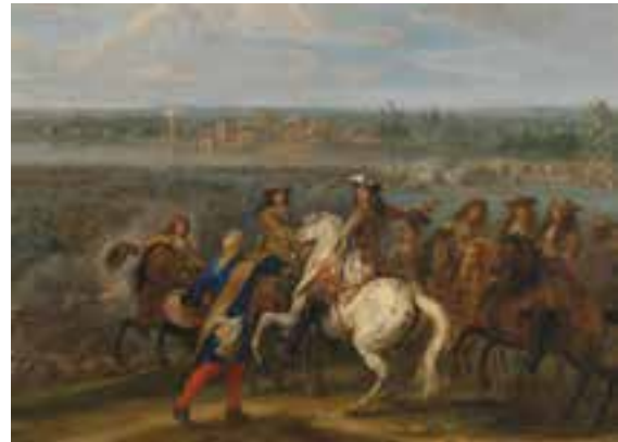
Adam Frans van der Meulen, Le Passage du Rhin 1672

LOBITH - Lobith 12 juni 1672, 15.000 soldaten steken Rijn over onder aanvoering van Lodewijk XIV, in aanwezigheid van zijn broer Philips en de beroemde legeraanvoerders Condé en Turenne. Over deze 'Passage du Rhin' zijn veel afbeeldingen, verhalen en feiten bekend, m.n. ook vanuit Franse bronnen. Het is een inspirerend kunstthema voor schilderijen (o.a. Louvre), plafondschilderingen (o.a. Versailles) en sculpturen o.a. op een triomfboog in Parijs. 'Rampzalig' simpel begonnen de Fransen aan hun 'blitzkrieg' aan de oostgrens van de Republiek. Het toenmalige Oost-Gelderse rivierlandschap vormde het militair-strategische decor voor 'Franse glorie en Hollands debacle'. De regio Lobith, Schenkenschans, Liemers en de Achterhoek bleken symptomatisch voor het militair onthutsend zwakke Holland. Vanaf startdatum 11/12 juni 2022 zijn er presentaties (reader, lezing, film, podcast, tentoonstelling, maquette) en wandel-fietsroutes, gebruik makend van verschillende invalshoeken: de 'Passage du Rhin' zelf, de inspiratie die dit opleverde voor de vele (Franse) kunstwerken en de betekenis van het 17e-eeuwse rivierlandschap. info@heemkundekringrijnwaarden.nl