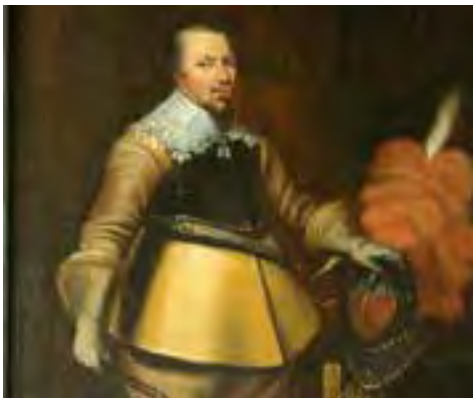
Ernst Casimir, graaf van Nassau-Dietz

LEEK - De borg Nienoord is van oudsher hét centrum van krijgsmacht in het Groninger Westerkwartier. Schietnissen in de buitenmuur, driedubbele grachten, de fundamenteën van een poort: veel herinnert hier nog aan.