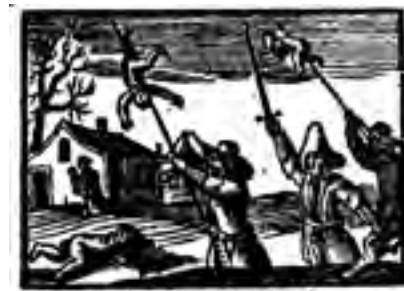
Deze Waerheyt is van de Jaren, de Misdeeden der men aangeen Ginghen aan de Plack die haer een Kuchel blagen, Eel wil niet sijn gezond, om dat 't haer Landen het Te samen van de duivel, in Jansen en verdien.

Houtsneede uit Spiegel der Jeugd: fake news of realiteit?