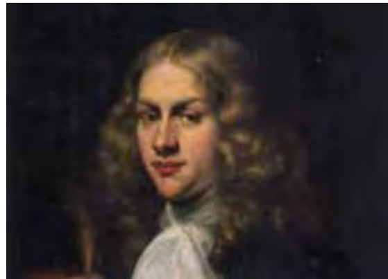
Godard van Reede, de latere graaf van Athlone