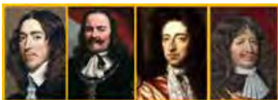
Bij de Nationale Herdenking staan De Witt, De Ruyter, Prins Willem III en Rabenhaupt centraal

HILVERSUM – In het Jubileumjaar 2022 krijgt de Rampjaarherdenking landelijk veel aandacht. Voor de NPO en de Afdeling Geschiedenis van de NTR