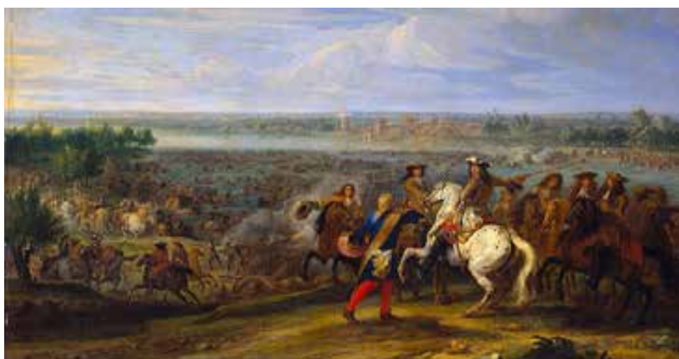
Lodewijk XIV trekt bij Lobith de Rijn over (12 juni 1672), door Adam Frans van der Meulen

De tijdlijn van het Rampjaar loopt van voorjaar 1672 tot en met najaar 1673, toen de Franse troepen wegtrokken. Overigens bleef een deel van de Republiek bezet, o.a. Nijmegen (door de Fransen) en Oost-Nederland (door twee Duitse bisschoppen). Meer over de oorzaken en gevolgen van het Rampjaar op onze kennis-site www.rampjaar1672.info .