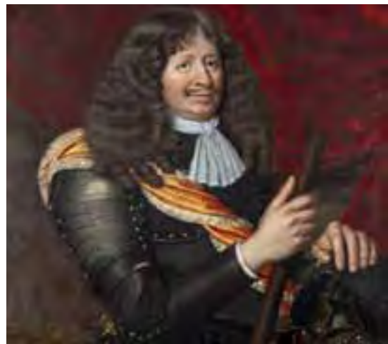
Carl von Rabenhaupt

GRONINGEN - Het Groninger Museum, Stedelijk Museum Coevorden en Noordelijk Scheepvaartmuseum organiseren in 2022 tentoonstellingen die ieder op eigen wijze het Rampjaar in 1672 belichten.