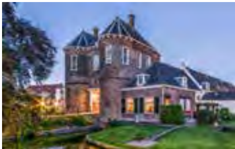
Kasteel Montfoort werd in het Rampjaar verwoest maar het poortgebouw bleef grotendeels behouden

In het Rampjaar 1672 was Utrecht een van de zwaarst getroffen provincies, door oorlogshandelingen, inundaties en de Franse bezetting. Van de ca 150 verwoeste kastelen lag meer dan de helft in Utrecht; zo werden de meeste kastelen in de Vechtstreek verwoest.