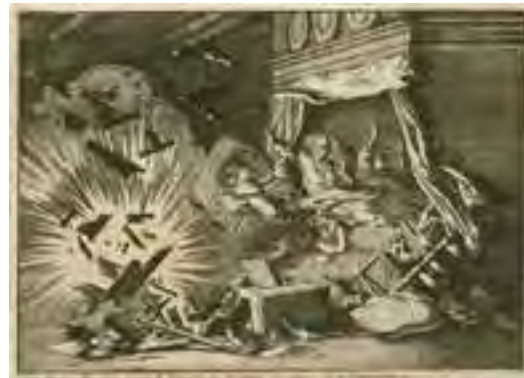
Bominslag tijdens het beleg in 1672 (kopergravure)