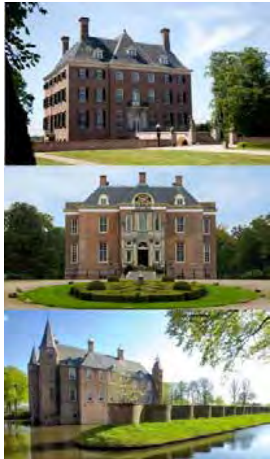
Middachten, Amerongen en Zuylen

AMERONGEN - Kasteel Amerongen, Slot Zuylen en Kasteel Middachten bevonden zich tijdens het Rampjaar in bezet gebied, waardoor ze met elkaar verbonden waren in hun noodlot. De drie kastelen hebben een gezamenlijk educatief programma ontwikkeld over het Rampjaar 1672. Zo wordt er een lesbrieven ontwikkeld voor het voortgezet onderwijs in de leeftijd van 12 tot en met 15 jaar.