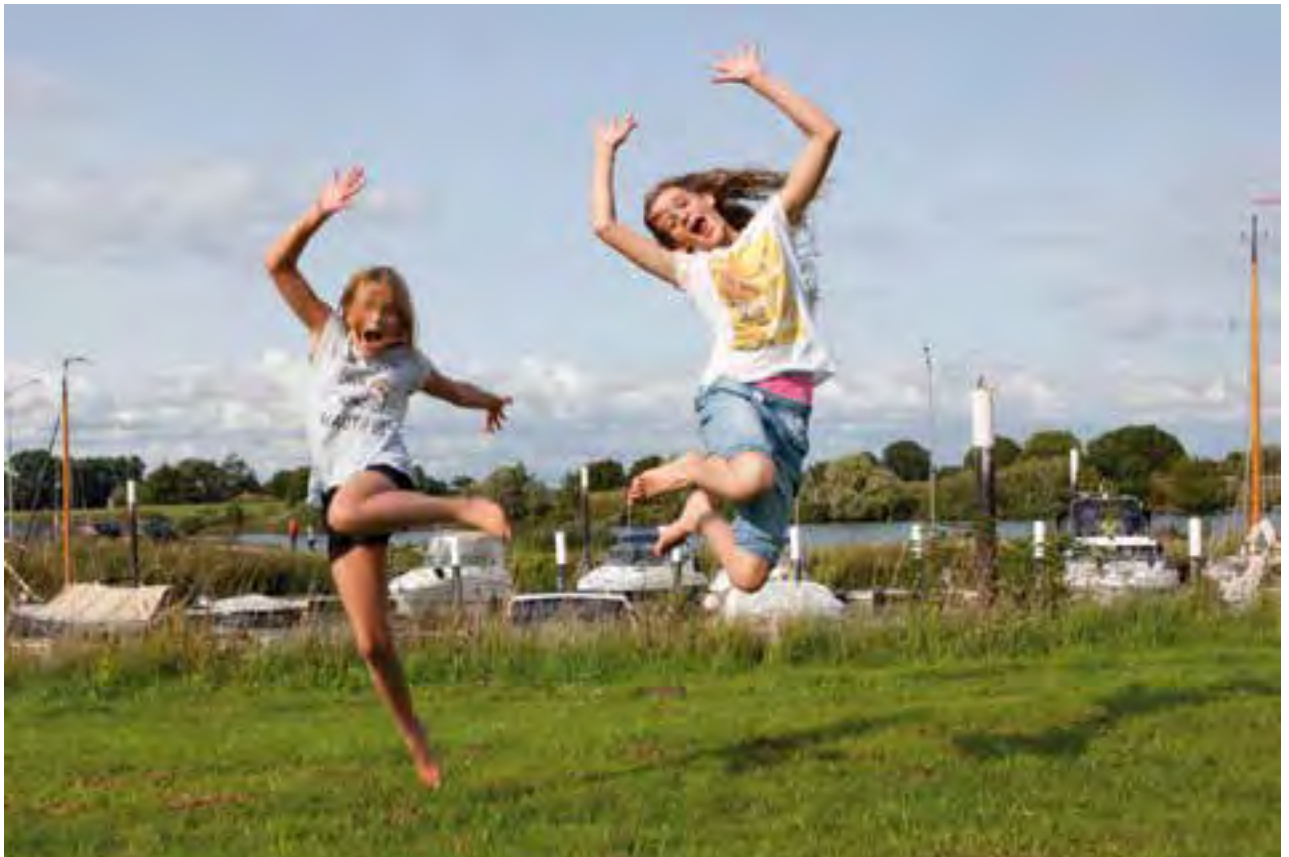
In de haven van Ravenstein