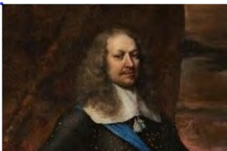
Adriaan van Reede

AMERONGEN - Adriaan van Reede, heer van Amerongen, excelleerde als diplomaat. Zijn missie naar Frederik Willem, keurvorst van Brandenburg,