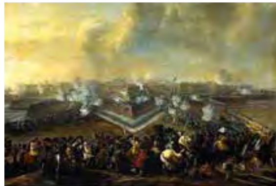
'De bestorming van Coevorden, 30 december 1672', Pieter Wouwerman, collectie Rijksmuseum Amsterdam