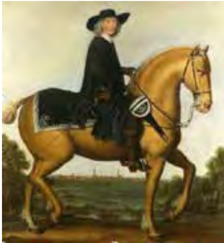
Ruiterportret Bernhard von Galen met Groningen op de achtergrond

GRONINGEN - Het Groninger Museum organiseert een grote tentoonstelling over het Groningens Ontzet met portretten van hoofdrolspelers, schilderijen en tekeningen van het beleg en veel meer.. Behalve eigen bezit van Groninger Museum en Groninger Archieven zijn er bijzondere stukken uit het bezit van de belager de vorst-bisschop Bernard von Galen van Munster zelf zoals kerkelijk zilver, zijn reiskleding, zijn borstkruis, zijn servies en een kanon uit zijn bezit. Bijzonder is ook een grote selectie zilveren herdenkingspenningen. De gebeurtenis van het Rampjaar heeft een blijvende plaats in de Groninger kalender gekregen. Het wordt elk jaar nog herdacht in augustus en ook die jaarlijkse feestelijkheden zullen aandacht krijgen in de expositie. Van 23 april t/m 30 oktober 2022 www.groningermuseum.nl