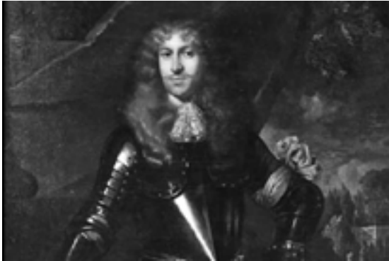
Frederik van Nassau Zuylestein (1624-1672)

WOERDEN - In de nacht van 10 op 11 oktober 1672 vond een van de grootste veldslagen van het Rampjaar 1672 plaats: de Slag om Woerden, ook wel bekend als de Slag om de Kruipin. Die naam is niet geheel juist, want de strijd speelde zich in heel Woerden af van de Pannenbakkerijen tot de Groepenbrug. Drie generaals en stadhouder Willem III probeerden het door de Fransen bezette Woerden te bevrijden. Daarbij sneuvelden 2.500 Franse en Hollandse soldaten; ook Willem's oom Nassau Zuylestein die een heldendood stierf: hij kreeg maar liefst 18 steken in de borst...