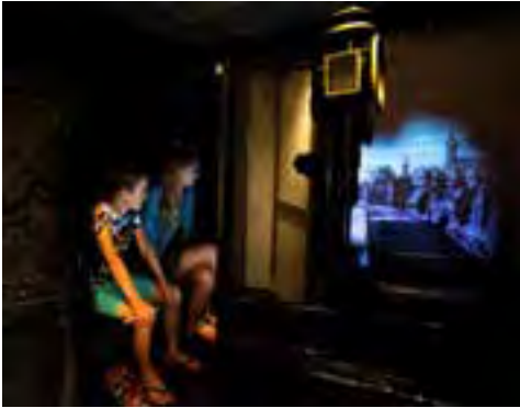
Ga mee op reis door Utrecht tijdens het Rampjaar.