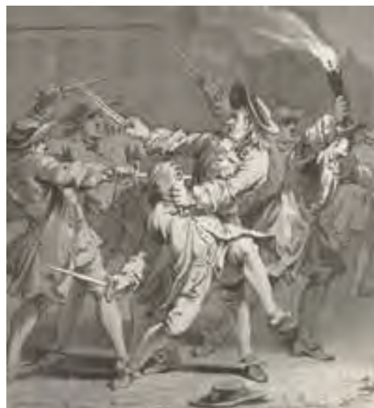
Johan de Witt aangevallen en zwaar gewond