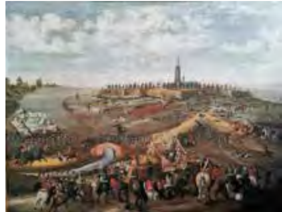
De Berening van Aardenburg, juni 1672

AARDENBURG - Op 1 april 1672 hoorden de inwoners van Aardenburg dat de vesting ontmanteld moest worden, maar een deel van de compagnie bleef op zijn post en bewaakte de stadspoorten. Toen in juni een Frans leger van 9.000 man in aantocht was, beschikte Aardenburg ter verdediging over nog geen 40 manschappen. Pas later arriveerden er wat versterkingen. De burgers kaptten kogels, smolten lood, wreven buskruit klein tot laadkruit, maakten schroot uit oud ijzer en brachten dit naar de wallen. En om de vijand te misleiden zetten de vrouwen hoeden op en verkleedden zich als mannen. Dankzij de inzet van garnizoen en burgerij werd de Franse "Berening" tegengehouden. De stad bleef gespaard en er werden zelfs 600 Franse soldaten gevangengenomen! Zo begon de Hollandse Oorlog met een fikse Franse nederlaag, dankzij het huzarenstukje van de Aardenburgers!