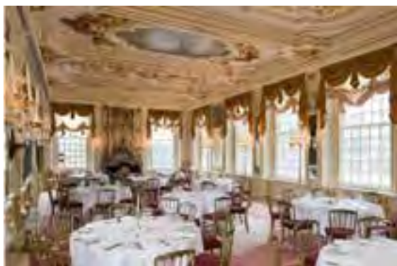
De Spiegelzaal van Slot Zeist