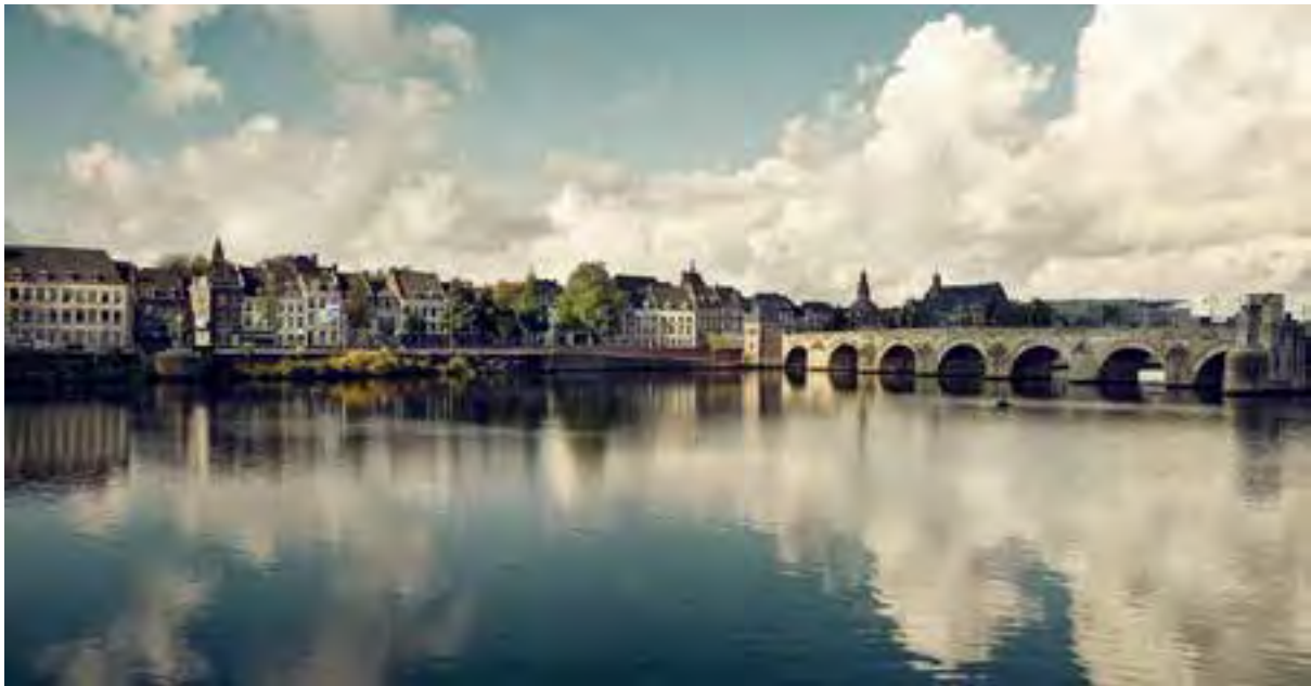
Maastricht: Ontdek Maastricht, de stad van de goede smaak!

Bij de vestingsteden en waterliniegemeenten is er veel belangstelling om deel te nemen aan de Rampjaarherdenking. Meer dan 90 steden hebben zich inmiddels aangesloten bij het Platform, waaronder steden als Groningen, Coevorden, Zwolle, Middelburg, Den Bosch en Maastricht. Alle steden zijn op de Vestingstedenkaart opgenomen met een korte story.