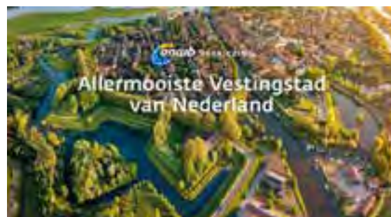
Door de ANWB is Gorinchem uitgeroepen tot allermooiste vestingstad van Nederland

GORINCHEM - De Vestingdriedoekdagen vinden plaats op 18 en 19 mei 2022, aanhakend op de