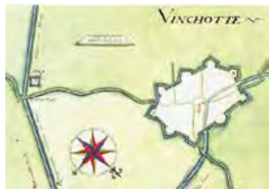
Contouren van de vesting Winschoten in 1640

Musea Heiligerlee: van 1 mei tot 1 november is de tentoonstelling Verborgene vestingen in het Groninger grensland te zien in Museum Slag bij Heiligerlee . Ontdek de geschiedenis van verdedigingswerken en vele resten van vestingwerken en schansen in de Oost Groninger grensstreek. Een mooie start voor een bezoek aan de vestingdorpen Oudeschans en Nieuweschans en de middeleeuwse kerk en toren van Winschoten.