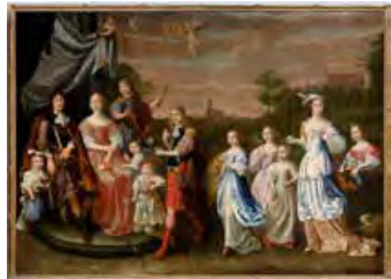
Familieportret Verhildersum, 1672