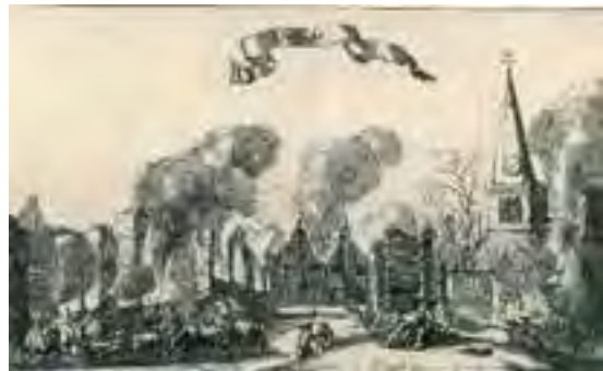
Abcoude in vlammen 1672

WOERDEN - Utrecht de stad en het geheele Sticht werd in den jaare 1672 bemagtigt van den francen: schrijft historicus Andries Schoemaker. Utrecht was een van de zwaarst getroffen gewesten in het Rampjaar, door verwoesting, bezetting en inundaties. Het Platform Rampjaarherdenking organiseert hierover op vrijdag 7 oktober 2022 in Paushuizen in Utrecht een Dag van het Rampjaar met lezingen, presentaties en excursies. Daarbij worden de RHC's en historische verenigingen in de provincie actief ingeschakeld. Ook komt er een expositietournee langs Utrechtse bibliotheken.