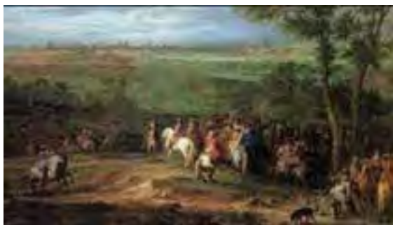
Adam Frans van der Meulen, Beleg van Maastricht 1673

De rivaliteit tussen twee historische tegenstrevers – stadhouder Willem III en Zonnekoning Lodewijk XIV – staat centraal in een grote tentoonstelling in het Limburgs Museum. In 2023 is het 350 jaar geleden dat Lodewijk XIV persoonlijk het beleg van Maastricht leidde. De voor dat jaar geplande tentoonstelling Oranje en de Zonnekoning: Slaags aan de Maas toont onder meer wie de rivalen