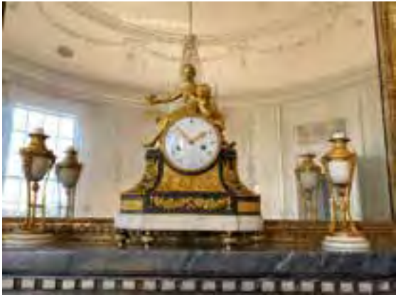
De Maaskamer in het Dordts Patriciërshuis